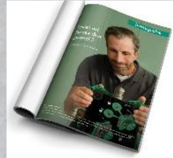
iBox universal 2 folleto