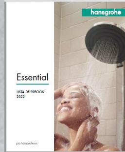
Essential Catalogue 2023