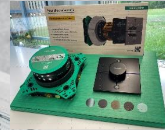
1 Fontana EcoSmart