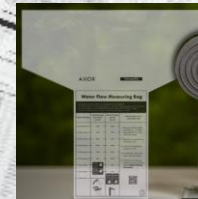
Bolsa de caudal EcoSmart