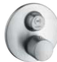
Ecostat® S Termostat podtynkowy Start/Stop