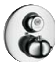
Ecostat® E Start/Stop # 15740,-000