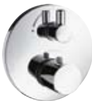
Ecostat® S ze zintegrowanym zaworem odcinającym # 15701,-000,-880