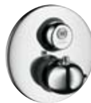
Ecostat® E Termostat podtynkowy Start/Stop