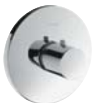
Ecostat® S Termostat podtynkowy