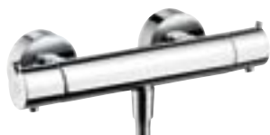
Ecostat® S do prysznicca # 13235,-000