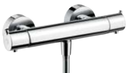
Ecostat® S Termostat natynkowy do prysznica

Termostat Ecostat S bliski jest armaturze linii S. Podstawowe formy geometryczne – koło, prosta, kąt prosty i przekątna tworzą cały design. Tworzona konsekwentnie aż po najmniejszy detal linia S przekonuje swą orzeźwiającą przejrzystością form.