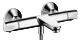
Ecostat® E do wanny # 13145,-000