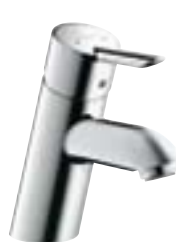
Focus® S Bateria umywalkowa