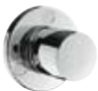
Trio®/Quattro® Zawór przełączający Element zewnętrzny S # 15932,-000,-880