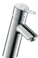
Talis® S² Bateria umywalkowa