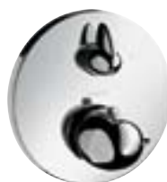
Ecostat® E Termostat podtynkowy ze zintegrowanym zaworem odcinająco-przełączającym