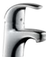
Focus® E Bateria umywalkowa