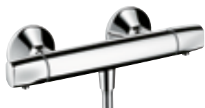
Ecostat® E do prysznica # 13125,-000