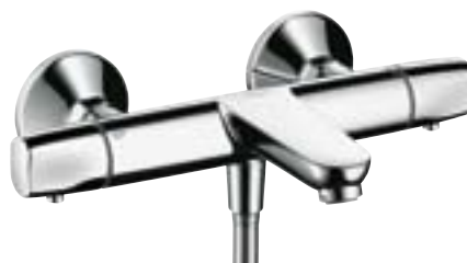
Ecostat® E Termostat natynkowy do wanny