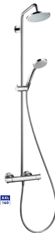
Croma® 100 Showerpipe Ø 160 mm # 27169,-000 (dostępny od kwietnia 2008)