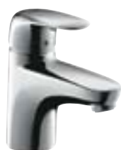
Metris® E Bateria umywalkowa

Pasujące baterie umywalkowe z linii armatury E