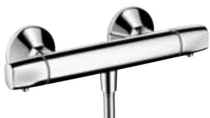
Ecostat® E Termostat natynkowy do prysznic

Termostat Ecostat E perfekcyjnie harmonizuje z armaturą Hansgrohe z linii E. Organiczne, opływowe kształty, miękkie, zaokrąglone linie dodają armaturze dynamiki i elegancji zarazem.