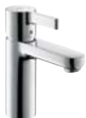
Metris® S Bateria umywalkowa

Pasujące baterie umywalkowe z linii armatury S