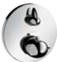
Ecostat® E Termostat podtynkowy ze zintegrowanym zaworem odcinającym