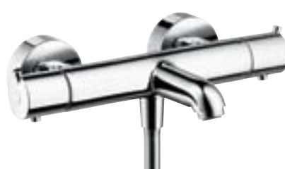
Ecostat® S Termostat natynkowy do wanny