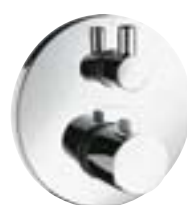
Ecostat® S Termostat podtynkowy ze zintegrowanym zaworem odcinająco-przełączającym