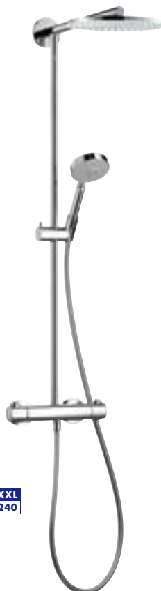
Raindance® Showerpipe Ø 240 mm # 27160,-000 Raindance® Showerpipe EcoSmart 9,5 l/min. Ø 180 mm # 27165,-000