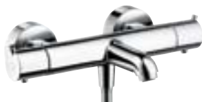
Ecostat® S do wanny # 13245,-000