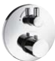
Ecostat® S Termostat podtynkowy ze zintegrowanym zaworem odcinającym