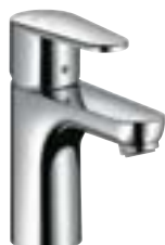
Talis® E 2 Bateria umywalkowa