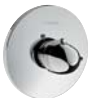
Ecostat® E Termostat podtynkowy