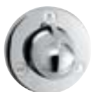
Trio®/Quattro® Zawór przełączający Element zewnętrzny E # 15931,-000,-090,-880