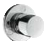
Trio®/Quattro® Zawór przełączający

Pasujące baterie umywalkowe z linii armatury S