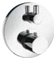
Ecostat® S ze zintegrowanym zaworem odcinająco-przełączającym # 15721,-000,-880