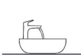
Waskom met de kraan er op geplaatst