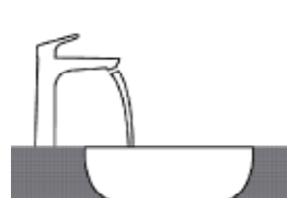
Inbouw- of opbouwwasta- fel met de kraan er achter geplaatst