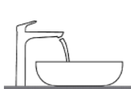
Waskom met de kraan er achter geplaatst

Bij de bekende wastafelsoorten vindt u altijd een bijpassende Hansgrohe kraan. De Hansgrohe ComfortZone Test biedt uitgebreide informatie over een perfecte installatie van wastafelkraan en wastafel, voor comfortabel en spatvrij gebruik. Bij de Hansgrohe ComfortZone Test zijn vijf verschillende wastafelsoorten getest: