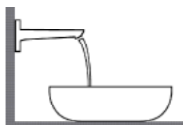
Waskom met wandmeng- kraan kraan