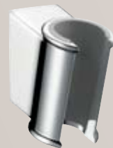
Porter Classic # 28324, -000, -820

Croma® Classic 100 Multi Brausenset mit Sensoflex® Brausenschlauch und Unica® Classic Brausenstange 90 cm # 27768, -000, -820 65 cm # 27769, -000, -820 (o. Abb.)