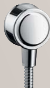
Fixfit® Schlauchanschluss DN15 # 16884, -000, -820