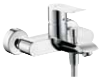
Metris® Einhebel- Wannenmischer