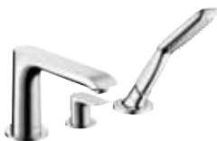
Metris® 3-Loch Einhebel- Wannenrandarmatur