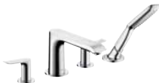
Metris® 4-Loch Wannenrandarmatur