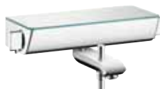
Ecostat® Select Wannenthermostat