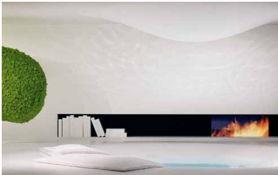
Ахор WaterDream 2005 от Жана-Мари Массо