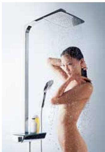
Hansgrohe Raindance Select