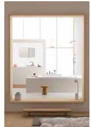
Axor Bouroullec, 2010