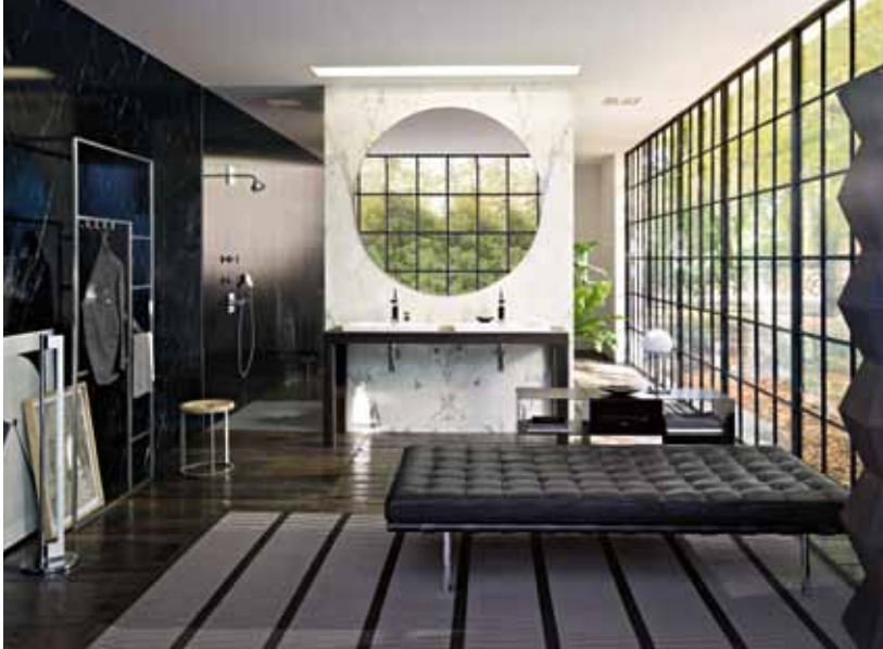
Axor Citterio, 2010