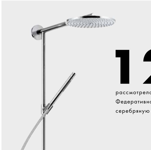
Hansgrohe Raindance Connect EcoSmart