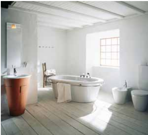
Axor Starck, 1994