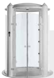
Hansgrohe Pharo «Храм воды» 160