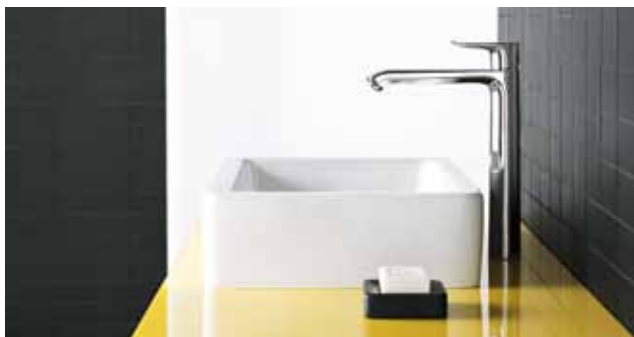
Metris® 260 hinter frei stehendem Aufsatzbecken

Erst in Verbindung mit dem passenden Waschtisch erfüllt eine Metris Armatur genau die Ansprüche, die Sie haben. Unsere Keramikempfehlungen sind keine festen Vorgaben, sie dienen als optische Orientierung, um die für Sie perfekte Zusammenstellung zu finden. Entdecken Sie Ihre Traumkombination auf hansgrohe-keramikempfehlungen.com