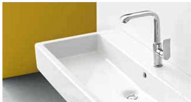
Metris® 230 auf Waschtisch