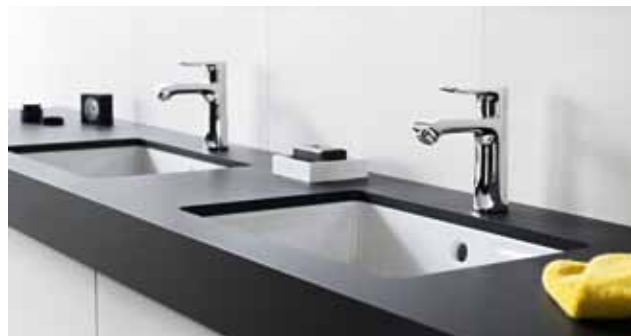
Metris® 110 auf Einbauwaschtisch

de-CH-Hansgrohe Metris Broschüre · Technische Änderungen sowie Farbabweichungen aus drucktechnischen Gründen vorbehalten. Form-Nr. 84100593 - 11/10/4..5 · Printed in Germany · Gedruckt auf 100% chlorfrei gebleichtem Papier