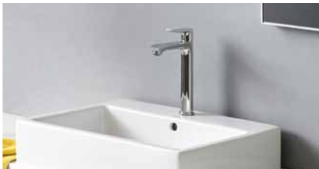
Metris® 200 auf Aufsatzbecken