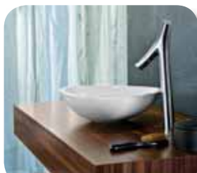
Axor Starck Organic