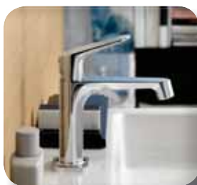
Axor Citterio M