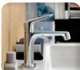
Axor Citterio M