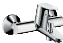
Jednouchwytywa bateria wannowa Montaż natynkowy # 31940, -000