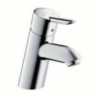
Focus® S bateria umywalkowa

Focus® S. Walec, kula i stożek – na tych podstawowych bryłach geometrycznych oparta jest koncepcja linii armatury Focus S 2 . Charakterystyczny smukły i prosty uchwyt ułatwia obsługę baterii. Zredukowaną formę ma też zestaw prysznicowy Crometta 85 / Unica Crometta z regulacją wysokości prysznica.