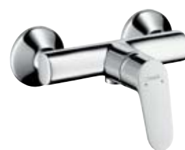
Jednouchwytywa bateria prysznicowa Montaż natynkowy # 31960, -000