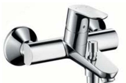
Focus® E 2 bateria wannowa