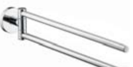
Wieszak na ręcznik # 40512, -000