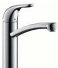
Jednouchwytywa armatura kuchenna # 31780, -000