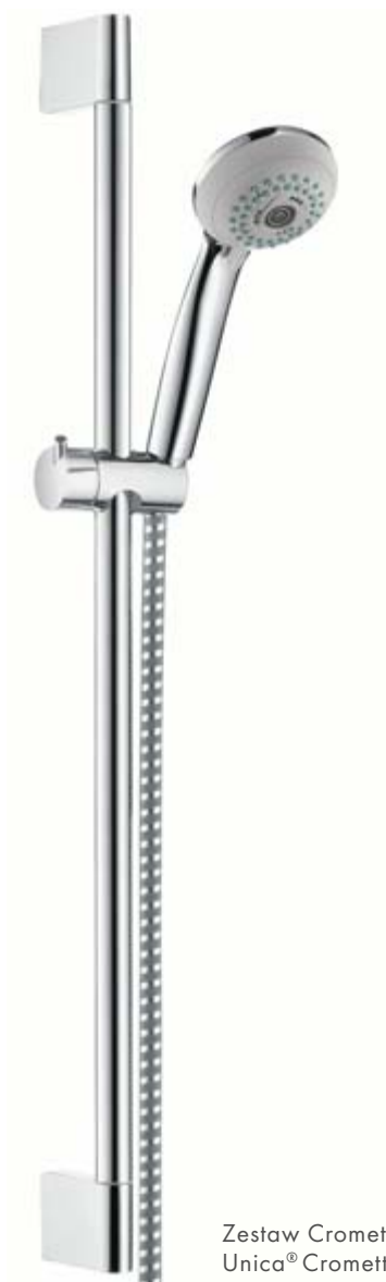
Zestaw Crometta® 85 Multi/ Unica® Crometta