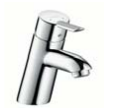
Jednouchwytywa bateria umywalkowa # 31701, -000 Jednouchwytywa bateria umywalkowa Project (bez ciągła) # 31711, -000 (bez fot.)