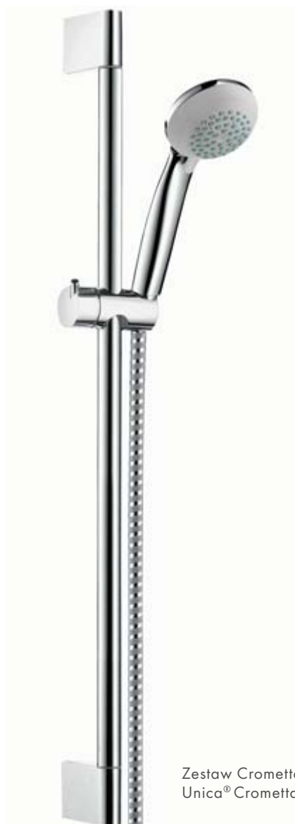
Zestaw Crometta® 85 Vario/ Unica® Crometta