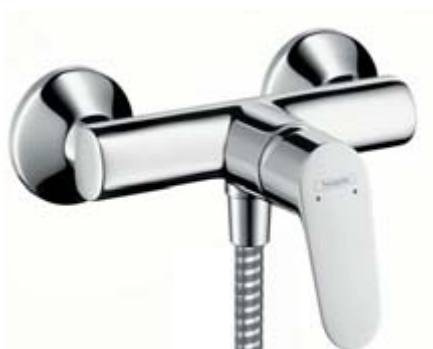
Focus® E 2 bateria prysznicowa