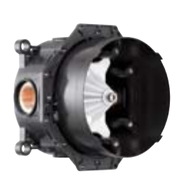
Zestaw podstawowy do iBox® universal z mosiądzu # 01800180