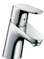
Jednouchwytywa bateria umywalkowa # 31730, -000 Jednouchwytywa bateria umywalkowa Project (bez ciągła) # 31733, -000 (bez fot.)