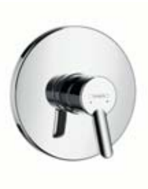
Jednouchwytywa bateria prysznicowa Montaż podtynkowy # 31763, -000