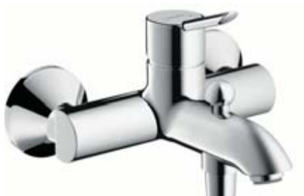
Focus® S bateria wannowa