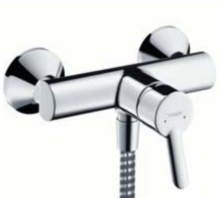
Focus® S bateria prysznicowa