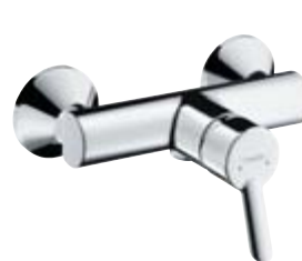
Jednouchwytywa bateria prysznicowa Montaż natynkowy # 31762, -000