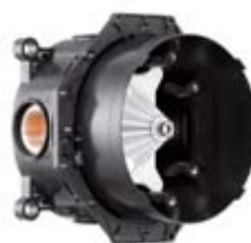
Zestaw podstawowy do iBox® universal z mosiądzu # 01800180