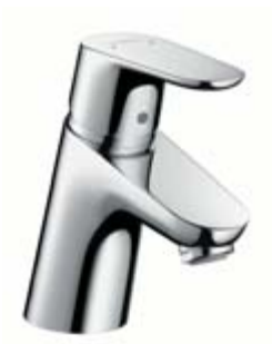
Focus® E 2 bateria umywalkowa

Focus® E 2 . Dynamiczna sylwetka, ergonomiczny uchwyt, przyjemne zaokrąglenia – design linii nowej armatury Focus E 2 wyraźnie odzwierciedla filozofię elegancji. Równie skromnie i wytwornie zarazem prezentuje się zestaw Crometta 85 Vario/Unica® Crometta, stanowiący harmonijne uzupełnienie baterii do wanien i pryszniców.