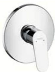
Jednouchwytywa bateria prysznicowa Montaż podtynkowy # 31965, -000