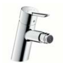
Jednouchwytywa bateria bidetowa # 31721, -000 Jednouchwytywa bateria bidetowa z łańcuszkiem # 31726, -000 (bez fot.)