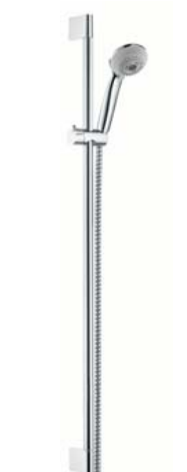
Zestaw Crometta® 85 Multi/ Unica®/Crometta® z węzłem prysznicowym Metaflex 1,60 m 90 cm # 27766, -000 65 cm # 27767, -000 (bez fot.)