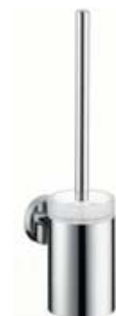
Uchwyt na szczotkę do WC # 40522, -000