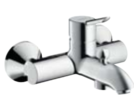
Jednouchwytywa bateria wannowa Montaż natynkowy # 31742, -000