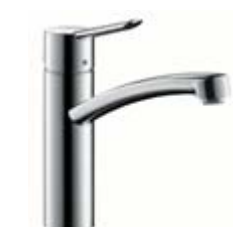
Jednouchwytywa armatura kuchenna # 31786, -000