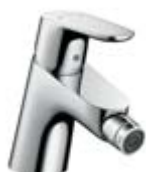
Jednouchwytywa bateria bidetowa # 31920, -000 Jednouchwytywa bateria bidetowa z łańcuszkiem # 31921, -000 (bez fot.)