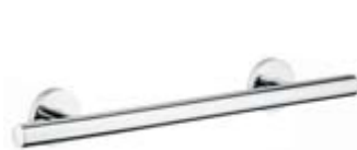
Wieszak na ręcznik kąpielowy 300 mm # 40513, -000