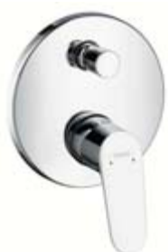
Jednouchwytywa bateria wannowa Montaż podtynkowy # 31945, -000 z systemem zabezpieczającym # 31946, -000