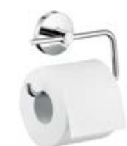
Uchwyt do papieru toaletowego bez osłony # 40526, -000