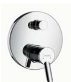
Jednouchwytywa bateria wannowa Montaż podtynkowy # 31743, -000