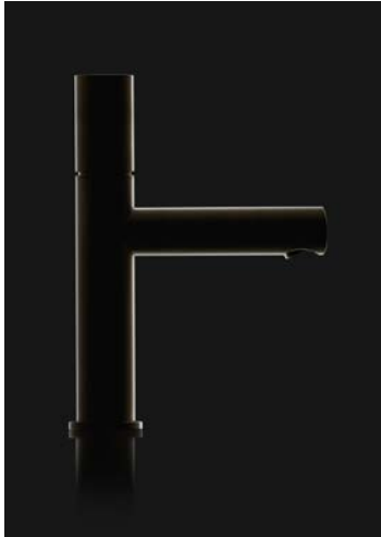
AXOR_Uno_Lever Black Shot